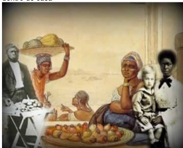
Imagem 3. Mulher e trabalho no século XIX: a vida dentro de casa

http://www.brasilecola.com/historiab/formas-trabalho-escravo-no-brasil.html